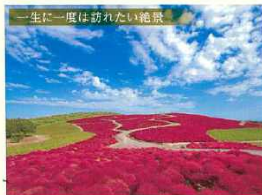
一生に一度は訪れたい絶景

国営ひたち海浜公園のコキア 公園の面積が、215haの広大な国営公園。春はネモフィラ、秋は真っ赤に染まったコキアと色とりどりのコスモスが咲き誇ります。