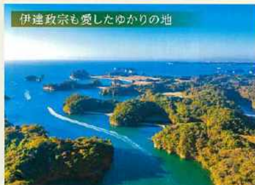
伊達政宗も愛したゆかりの地