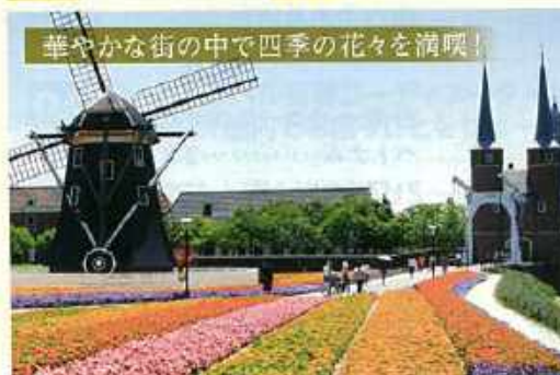
華やかな街の中で四季の花々を満喫!