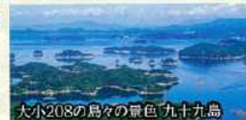
大小208の島々の景色 九十九島