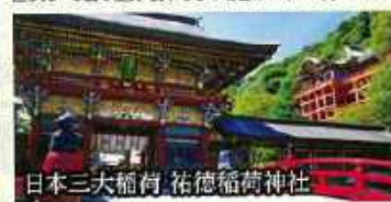
日本三大稲荷 祐徳稲荷神社