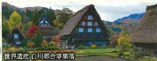
世界遺産 白川郷合掌集落