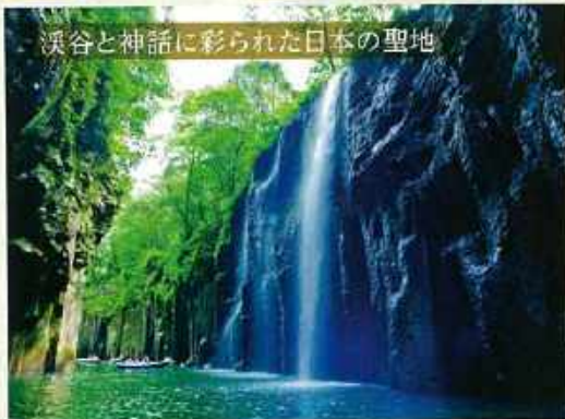
溪谷と神話に彩られた日本の聖地