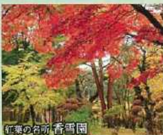
紅葉の名所 香雪園

湯の川では津軽海峡を望むオーシャンビューの露天風呂と、登別では高温の鬼サウナを体験。