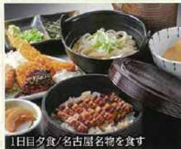
1日目夕食/名古屋名物を食す