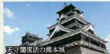
天守閣復活の熊本城