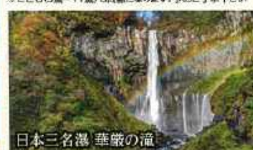
日本三名瀑 華厳の滝