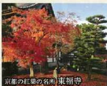
京都の紅葉の名所 東福寺

世界文化遺産である清水寺は、京都東山の音羽山の中腹に建つ寺院。創建は平安京の遷都よりも古く、778年に開山されたと言われる歴史ある寺院です。