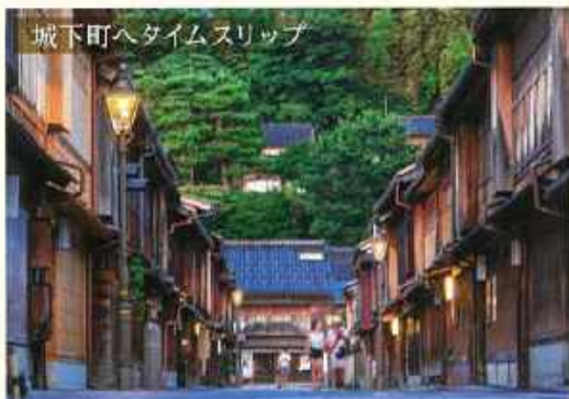
城下町ヘタイムスリップ

風情ある町並み 高山三之町 飛騨高山は城下町として商人町へ発達した上町と下町の三筋の町並とあわせて「古い町並」と呼ばれています。みたらし団子や飛騨牛コロッケなど食べ歩きもお楽しみいただけます。