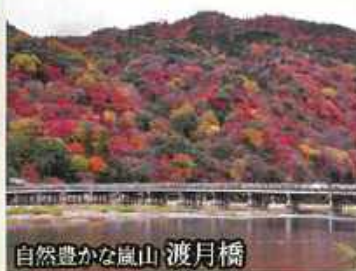
自然豊かな嵐山 渡月橋