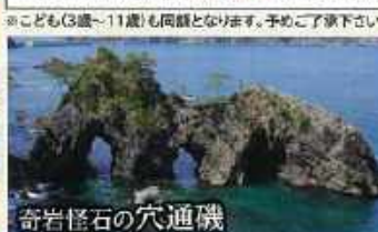
奇岩怪石の穴通磯