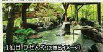
1泊目ひぜんや(お風呂イメージ)