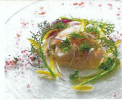
※料理写真はイメージ

窓から見渡す大景の素晴らしい景色を堪能できる。旭川上野ファームの絶景を堪能できる。旭川上野ファームの絶景を堪能できる。