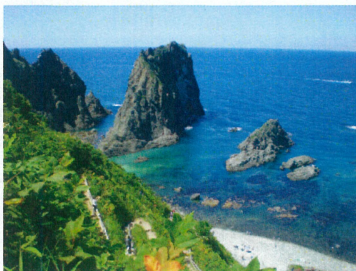
日本渚百選島武意海岸

積丹半島の前浜でとれた贅沢な海の幸を北海道産のななつぼしの上に厳選3種のネタが並びます。また積丹沖でとれたほっけを熱々でお召し上がりいただきます。