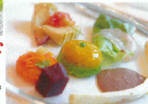
※料理写真はイメージ