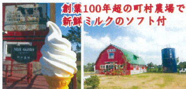
創業100年超の町村農場で新鮮ミルクのソフト付

良いエサを作り、良い牛をつくり、良い牛乳をつくるという精神のもと確かな品質の牛乳を作っています。スツキリとした後味の優しい甘みが広がる牧場ミルクソフトクリームをご賞味ください。