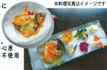
※料理写真はイメージです

「健康＝野菜の良さから」と、体に価値ある食を目指し、農業を基本的には使用せず、自社農園で手間ひまかけて育て上げた安全、安心な野菜のお話を聞きながら収穫体験をお楽しみいただけます。お食事調味料全てにおいても安心原料を厳選して使用し、化学調味料不使用の食事を提供しています。