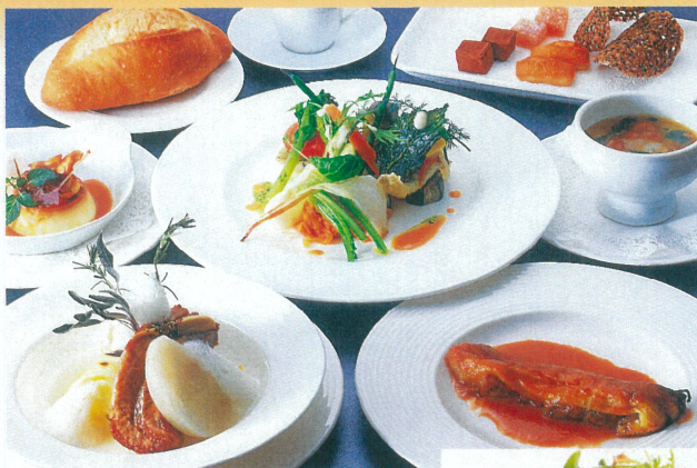
※料理写真はイメージ

5名~9名様の場合、上記ジャンボハイヤー追加代金がかかります。(ジャンボ推奨人数6~7名) 9名定員 旅行代金(お一人様) 5名様グループ 15,800円 6~8名様グループ 13,800円 9名様グループ 12,800円