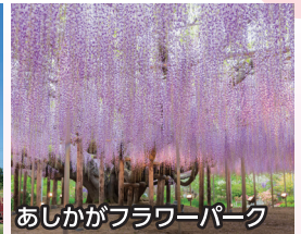
あしかがフラワーパーク 樹齢160年に及ぶ大藤棚がある 日本最大級の藤園