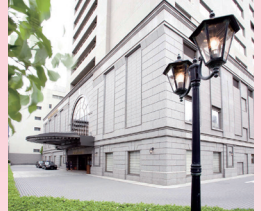
ホテル日航プリンセス京都 外観