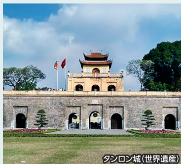
タンロン城(世界遺産)