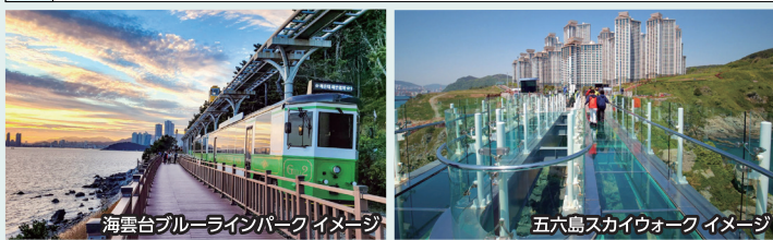
海雲台ブルーラインパーク イメージ