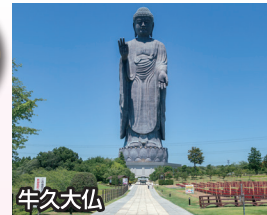
牛久大仏 ギネスブック認定、 世界最大120mの青銅製大仏