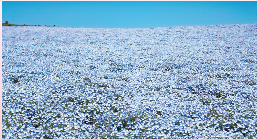
国営ひたち海浜公園 ネモフィラの丘

園内には各所に大規模な花畑があり、4月中旬からは、みはらしの丘一面にネモフィラが咲き誇り、他では見ることのできない絶景をご覧いただけます